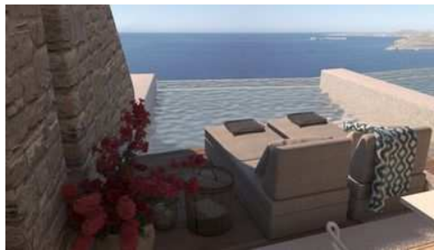
JUNIOR SUITE SEA POOL

El establecimiento cuenta con centro de negocios, tienda de recuerdos y servicio de alquiler de coches.