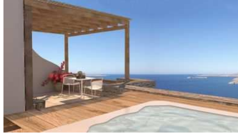
DELUXE SUITE JACUZZI