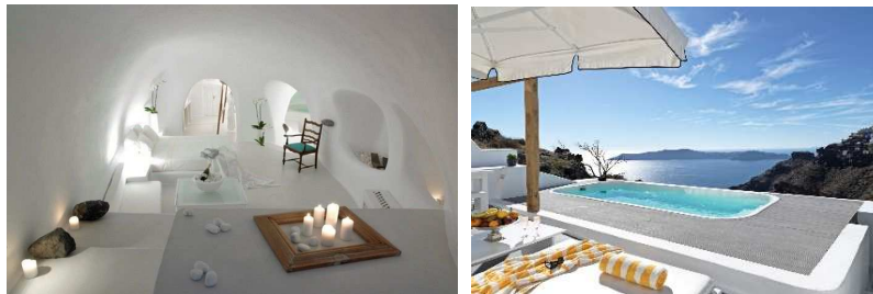
SAN NICHOLAS CAVE HOUSE VILLA

El bar de cócteles junto a la piscina y el salón restaurante sirven bebidas refrescantes, bocadillos y ensaladas recién hechas para el almuerzo o la cena. El alojamiento alberga el restaurante CHROMA Upstyle Dining, que elabora cocina mediterránea y ofrece carta extensa de vinos griegos e internacionales.