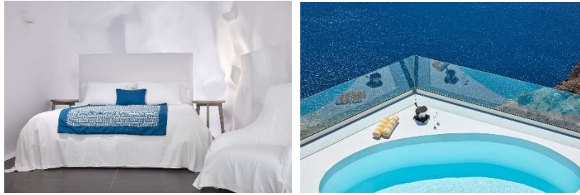
CHROMATA INFINITY POOL SUITE