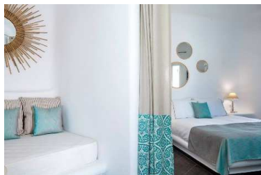
JUNIOR SUITE & OUTDOOR JACUZZI

Las suites y los alojamientos cuentan con aire acondicionado y zona de estar. La zona de cocina está equipada con nevera y utensilios de cocina. El baño incluye ducha, albornoces y artículos de aseo gratuitos. Algunos alojamientos incluyen bañera de hidromasaje.