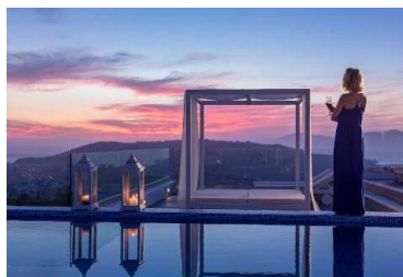
HONEYMOON SUITE SEA VIEW & OUTDOOR JACUZZI

El Colours of Mykonos Luxury Residences & Suites cuenta con jardín, zona de barbacoa y solárium. Se proporcionan toallas de playa y de piscina de forma gratuita.