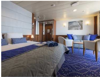
(9-HERA) SB - Suites con balcón

Las Grand Suites son amplias y tienen una cama king size, una sala de estar con sofá, vestidor y cuarto de baño con bañera, ducha y WC. El sofá se convierte en una cama y puede alojar cómodamente a una tercera persona. Todas las suites con aire acondicionado, balcón privado, una ventana de doble frente con persianas eléctricas, TV a color y video, nevera, secador de pelo, batas de baño, equipo de música y caja fuerte con cargo. Tenga en cuenta que la Balcony Suite (23 m 2 ) y la Grand Suite (34 m 2 ) son sólo accesibles por las escaleras de la cubierta 8