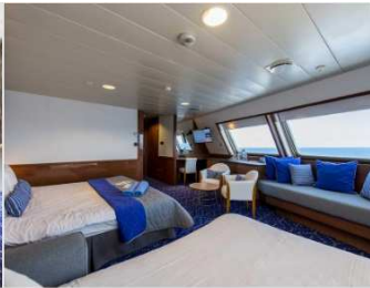
(9-HERA) SG - Grandes Suites