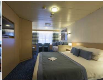
(7-APOLLO) SJ - Suites Junior