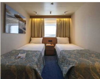
(3-HERMES / 4-POSEIDON)