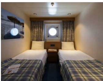
(2-ATHENA / 3-HERMES)