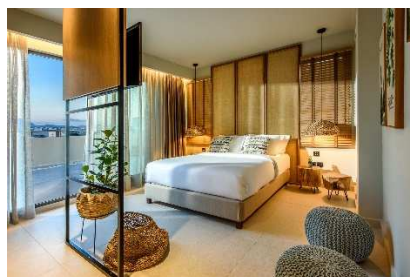
JUNIOR SUITE HOT TUB