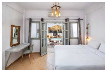
DOUBLE POOL VIEW