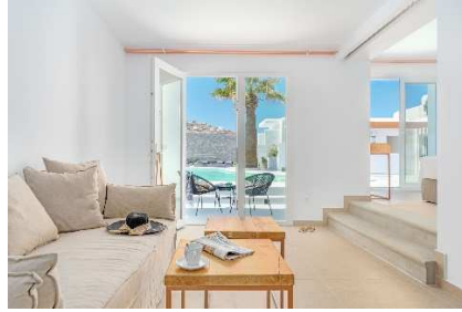
DELUXE SUITE POOL OR ISLAND VIEW

El establecimiento sirve un desayuno continental o buffet.