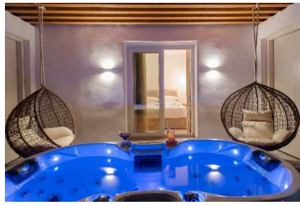
DELUXE JACUZZI GARDEN VIEW