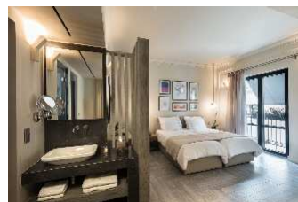
TWO BEDROOM SUITE

Todas las mañanas se sirve un desayuno buffet y a la carta.