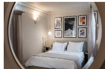
EXECUTIVE WITH BALCONY