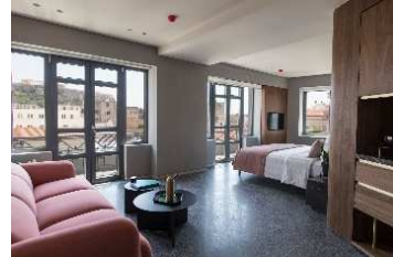
PERIANTH SUITES ACROPOLIS VIEW

Los huéspedes podrán comenzar el día con un desayuno buffet que se sirve cada mañana en el establecimiento. Además, se proporciona servicio de habitaciones.