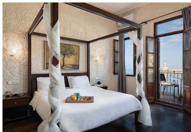
SUPERIOR VISTA MAR

Todos los alojamientos tienen TV de pantalla plana y nevera pequeña. Se proporcionan cajas fuertes y conexión WiFi gratuita en todas las instalaciones.