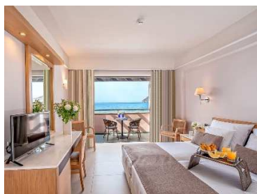
DOBLE SEA VIEW

Todas las habitaciones están completamente equipadas y tienen balcón con vistas al mar, a la piscina o al jardín. A la llegada, todos los huéspedes reciben una cesta de fruta con una botella de vino y un vale de regalo para el spa.