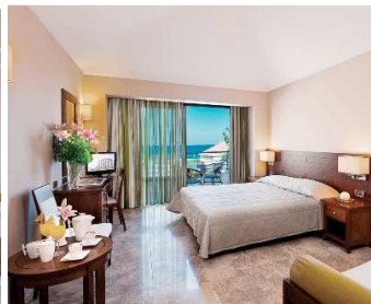
STUDIO SEA VIEW